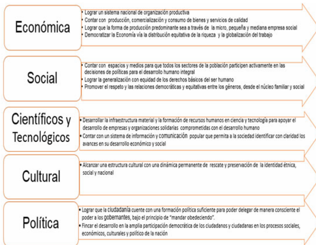
Figura 2. Dimensiones por Objetivos a considerar en la economía popular y solidaria (Fonteneau, Nyssens & Fall, 1999).

Es por ello que, en correspondencia con la concepción de EPS analizada, Fonteneau, Nyssens & Fall (1999) se identifican una serie de objetivos a desplegar en la realización de este tipo de forma económica que va a tributar al desarrollo local. Dichos objetivos se relacionan por dimensiones para lo cual se identifica la dimensión: económica, social, cultural y política ( figura 2 ).