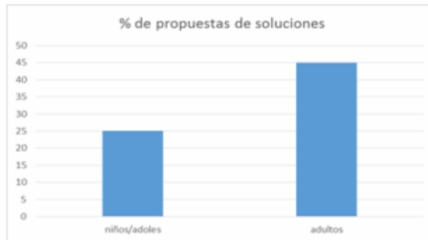
Figura 3. Porcentaje de respuestas con propuestas de soluciones en ambos estratos de la comunidad El Pitirre.

para decidirse a proponer posibles soluciones; fue más crítica la situación en el caso del grupo de menor edad, lo cual es paradójico, pues contrasta con otros resultados en que los niños parecen estar más involucrados; en este caso de una evidente comunidad aislada, no fue así (figura 3).