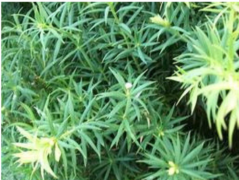
Sabina cimarrona (Podocarpus angustifolius)