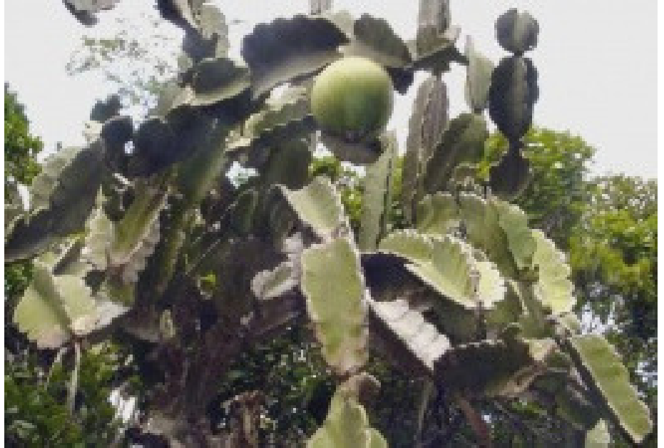
Aguacate cimarrón (Dendrocereus nudiflorus)